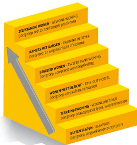
Tabel: Ladder om de maatschappelijke positie van (zorg)doelgroepen te visualiseren